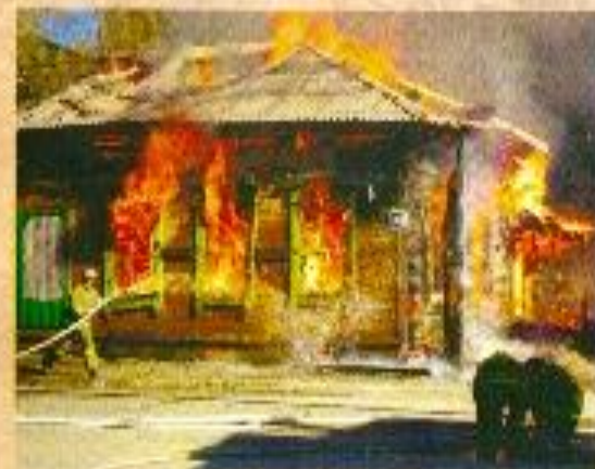
В этом доме в поселке "Урвал" Ангарского района 2 января 2014 г. при пожаре погибли три детей.